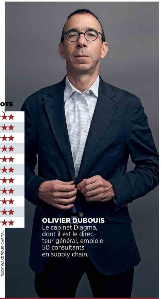
RUDY WANS POUR CAPITAL

L'expansion de l'e-commerce (qui va bientôt franchir la barre des 70 milliards d'euros en France), combinée à l'internationalisation des marchés (côté clients et côté fournisseurs), conduit les industriels et les distributeurs à solliciter de nombreuses expertises. Les spécialistes comme Argon ou Diagma font face à des cabinets généralistes, qui offrent en plus parfois des prestations en système d'information.